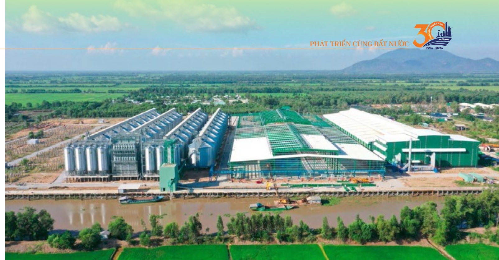
Nhà máy gạo Hạnh Phúc - Dự án tiêu biểu được SHB cho vay sử dụng nguồn vốn do World Bank tài trợ

SHB luôn kiểm soát an toàn, bền vững khi tài trợ các dự án. Các dự án phải đáp ứng được các điều kiện khắt khe theo tiêu chuẩn quốc tế và trong nước về bảo vệ môi trường, tiết kiệm năng lượng, tài nguyên. Vì vậy, khi đánh giá các dự án, SHB dựa vào bộ công cụ đánh giá rủi ro môi trường xã hội do NHNN phối hợp với IFC ban hành. Theo đó, với việc ra quyết định tín dụng, SHB sẽ thường bổ sung trong hợp đồng vay vốn: trách nhiệm và cam kết của khách hàng trong việc cải thiện quản lý rủi ro môi trường xã hội, một kế hoạch hành động và thời gian biểu để giảm thiểu rủi ro trước hoặc sau khi giải ngân khoản vay, những hành động của SHB để giới hạn trách nhiệm liên quan tới môi trường xã hội do các giao dịch gây ra.